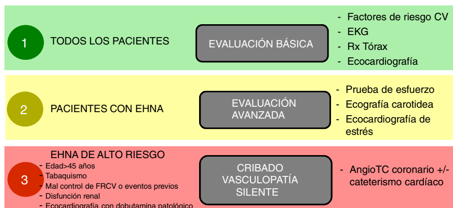
Figura 2 Esquema propuesto de evaluación cardiológica pretrasplante en función del riesgo cardiovascular. Notas: Los factores de riesgo cardiovascular deben controlarse adecuadamente antes del trasplante. La presencia de vasculopatía clínicamente significativa debe ser tratada y estabilizada antes del trasplante. Adaptado de Malhi et al. 169 .

autores han publicado series cortas donde demuestran que la realización de gastrectomía tubular en el mismo acto del TH ayuda a estos pacientes a bajar su IMC en el postrasplante precoz 171 . Sin embargo, no hay que olvidar que la cirugía bariátrica añade un extra de morbilidad al TH, a la vez que podría favorecer estados carenciales en el postrasplante inmediato, que a su vez impedirían la correcta recuperación del paciente. Por todo ello, aunque la cirugía bariátrica podría favorecer la mejoría del perfil metabólico en pacientes trasplantados por cirrosis asociada a EHNA, el momento óptimo para su realización no está definido, por lo que la indicación de TH y el tipo de cirugía bariátrica combinada en pacientes con IMC > 35 y DM debería individualizarse 171 . Recomendaciones.